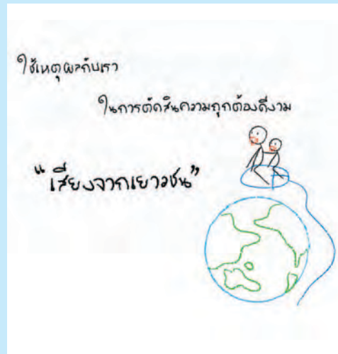
ผลงานจากค่าย ICTeen

ถึงแม้ว่าเยาวชนจะมีศักยภาพในการคิด การทำงาน แต่ผู้ใหญ่ยังคงมีบทบาทที่สำคัญในการดูแลอยู่ห่างๆ ให้ความช่วยเหลือเมื่อต้องการ ช่วยผลักดันเมื่อเห็นงาม เท่านั้นจะทำให้การทำงานของเยาวชนเป็นไปอย่างต่อเนื่องและยั่งยืนมากขึ้น