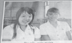
วิภาดา ภูมิลำเนา... (Caption text is partially obscured)