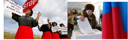
HIV & AIDS Democratic Governance