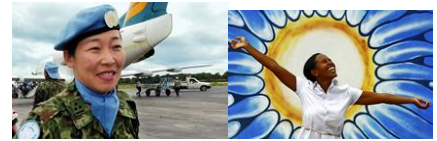
Women, War & Peace Human Rights