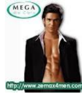
โฆษณาอาหารเสริมยี่ห้อหนึ่ง

ความเป็นชาย (Masculinity) หมายถึง สถานภาพหรือเงื่อนไขของร่างกายที่ทำให้ปรากฏคุณลักษณะของเพศชาย 7 นอกจากนั้น ความหมายของความเป็นชาย ยังหมายถึงคุณภาพทั่วไปของคุณลักษณะความเป็นชาย 8