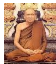
สมเด็จพระญาณสังวร สมเด็จพระสังฆราช สกลมหาสังฆปริณายก องค์พระประมุขของศาสนาพุทธไทยที่สงวนไว้สำหรับภิกษุสงฆ์เท่านั้น

ผู้ชาย (man ถ้าเป็นพหูพจน์ใช้คำว่า men) คือมนุษย์ผู้ชายที่เป็นผู้ใหญ่ หรือใช้เรียก มนุษย์ หรือ เพศชาย (คำว่า เด็กชาย เป็นคำปกติสำหรับเพศชายที่ยังเป็นเด็ก หรือ เป็นเยาวชน) อย่างไรก็ตามคำว่า “แมน/เมน” (man/men) บางครั้งก็ใช้ในความหมายโดยรวมหมายถึง “มนุษย์” ด้วย บางครั้งยังหมายถึง “บุรุษ” โดยไม่แยกอายุ ดังเช่นใช้ในความหมายว่า “สิทธิบุรุษ” (men’s rights)