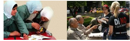
Women, Poverty & Economics Violence against Women

ภาพเหมารวม (stereotypes) อาจเป็นด้านบวกหรือด้านลบ แต่การสรุปภาพเหมารวมนั้นๆ ไม่อาจแสดงหรืออ้างถึงข้อมูลที่ถูกต้องหรือเที่ยงตรงเกี่ยวกับบุคคลหรือกลุ่มบุคคลเหล่านั้นได้ เมื่อผู้ใดมีสันนิษฐานด้านเพศภาวะอย่างหนึ่งอย่างใดต่อผู้อื่นโดยอัตโนมัติโดยไม่คำนึงถึงข้อเท็จจริงที่อาจตรงกันข้ามกับข้อสันนิษฐานนั้นๆ ผู้นั้นก็กำลังประทับภาพเหมารวมด้านเพศภาวะ และคนจำนวนมากตระหนักถึงอันตรายของการประทับภาพเหมารวมด้านเพศภาวะที่ทำให้เกิดการสร้างและสรุปภาพเหมารวมด้านเพศภาวะประเภทต่างๆ ขึ้น