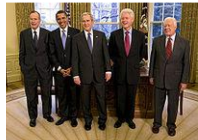
(จากซ้าย) ประธานาธิบดีแห่งสหรัฐอเมริกา จอร์จ เอช ดับเบิลยู บุช บารัค โอบามา จอร์จ ดับเบิลยู บุช บิล คลินตัน และ จิมมี่ คาร์เตอร์ ขณะที่ไม่มีการหมายส่งนสททให้ผู้ดำรงตำแหน่งประธานาธิบดีแห่งสหรัฐอเมริกาต้องเป็นผู้ชายเท่านั้นแต่ประธานาธิบดีทุกคนที่ผ่านมาจากสหรัฐอเมริกาล้วนเป็นผู้ชายทั้งสิ้น

ในวัฒนธรรมยุคก่อนประวัติศาสตร์ มีความเชื่อว่าผู้ชายคือพวกที่มีบทบาทหลากหลายในทางสังคมและทางวัฒนธรรม ซึ่งเหมือนบทบาทต่างๆ ของมนุษย์ ในยุคสังคมแห่งการล่าสัตว์และอยู่รวมกันเป็นกลุ่ม ผู้ชายจะเป็นพวกที่มีหน้าที่ในการล่า จับ เลี้ยงสัตว์ สร้างที่พักอาศัย และปกป้องหมู่บ้าน รวมทั้งทำหน้าที่อื่นๆ ที่เหมาะสำหรับการใช้แรงงานและร่างกายที่แข็งแกร่ง นักมานุษยวิทยาบางคนเชื่อว่ากลุ่มผู้ชายคือกลุ่มมนุษย์ที่เป็นผู้นำการปฏิวัติยุคหิน (Neolithic Revolution) และได้กลายมาเป็นนักปศุสัตว์ในยุคก่อนประวัติศาสตร์ (pre-historical ranchers) โดยมีผลที่เป็นไปได้ว่าบรรดาผู้ชายเหล่านั้นได้สะสมความรู้ด้านชีวิตของสัตว์ต่างๆ ไว้มาก