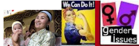
Millennium Development Goals