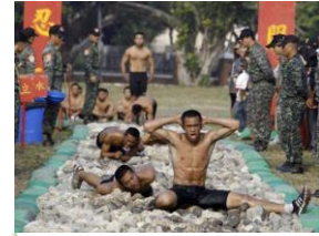
ผู้ชาย/วัดความเป็นชาย