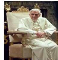
โป๊ป เบนเนดิกต์ที่ 16 คือผู้นำทางศาสนาของโบสถ์โรมันคาทอลิก เป็นสถานภาพที่สงวนไว้สำหรับผู้ชายเท่านั้น