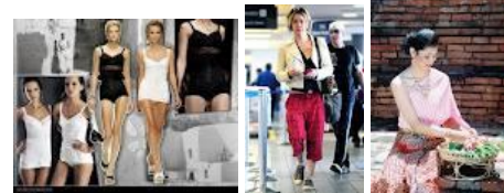
ผู้หญิง-ความเป็นหญิงในแบบต่างๆ

อุปนิสัยที่เชื่อมโยงสัมพันธ์กับความเป็นหญิงยังรวมถึงปัจจัยด้านสังคมและวัฒนธรรมและในหลายๆ กรณีขึ้นอยู่กับบริบททางพื้นที่และภูมิประเทศที่แตกต่างหลากหลายอีกด้วย 11